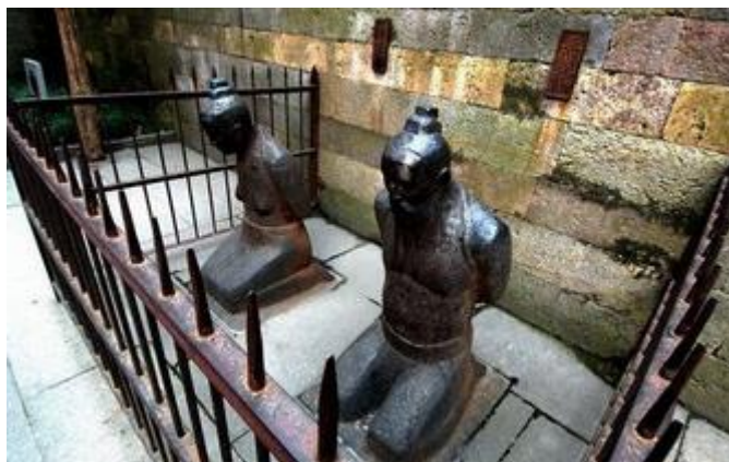
Yue Fei malheureusement trahi par un couple d'intriguants du ministère...