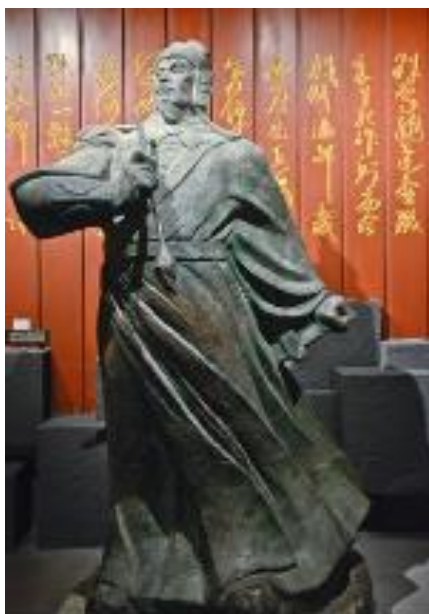
Le général Yue Fei (dynastie chinoise des Song du sud)