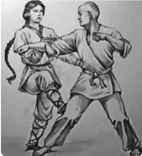
Wing Chun Quan

Le bœuf de métal manifeste un environnement parfaitement structuré, dominé par un pragmatisme prudent, sans enthousiasme débordant, les choses se feront en temps et en heure par la patience dans l'épreuve. Il s'attire à lui uniquement des personnes de confiance qui partagent les mêmes valeurs de droiture que lui, celles et ceux sur qui il peut compter. S'il souffre, c'est normal au travail, il le fait en silence ; s'il est content l'expression de satisfaction sera modérée, car sa vigilance craint en permanence la probable chute d'une épée de Damoclès, voilà pourquoi il ne peut se reposer de travailler, de s'exercer de peur d'être trahi ou que les affaires le lâchent.