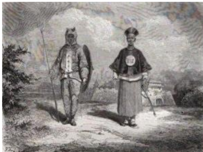
Le soldat tigre : les attributs guerriers portent l'image du tigre

Le foie appartient au canal Jue Yin en association avec le Maître Cœur. Si le Maître Cœur constitue le premier ministre dragon du Cœur esprit Shen, le Foie est le général tigre qui commande les armées donc les interventions militaires, dans le corps, il s'agit du système d'attaques et de défenses immunitaires. Un système immunitaire tombé dans l'oubli par la politique de gestion du covid19, qui pourrait bien et fort heureusement se rappeler à notre bon souvenir !